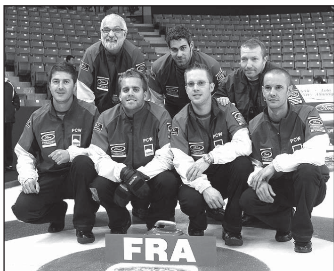
L'équipe au complet, tandis que les balais sont rentrés au vestiaire.

De notre envoyée spéciale, Kaoutar Kerkache.