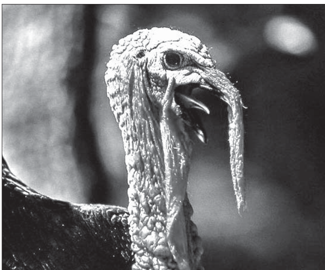
Le dindon de la grippe...

Cette grippe a été découverte en Allemagne, contrairement à ce que croient toutes les personnes, elle n'a pas été découverte au Mexique.